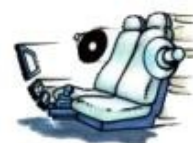
ISO KONEKTOR REPRODUKTOROVÝ